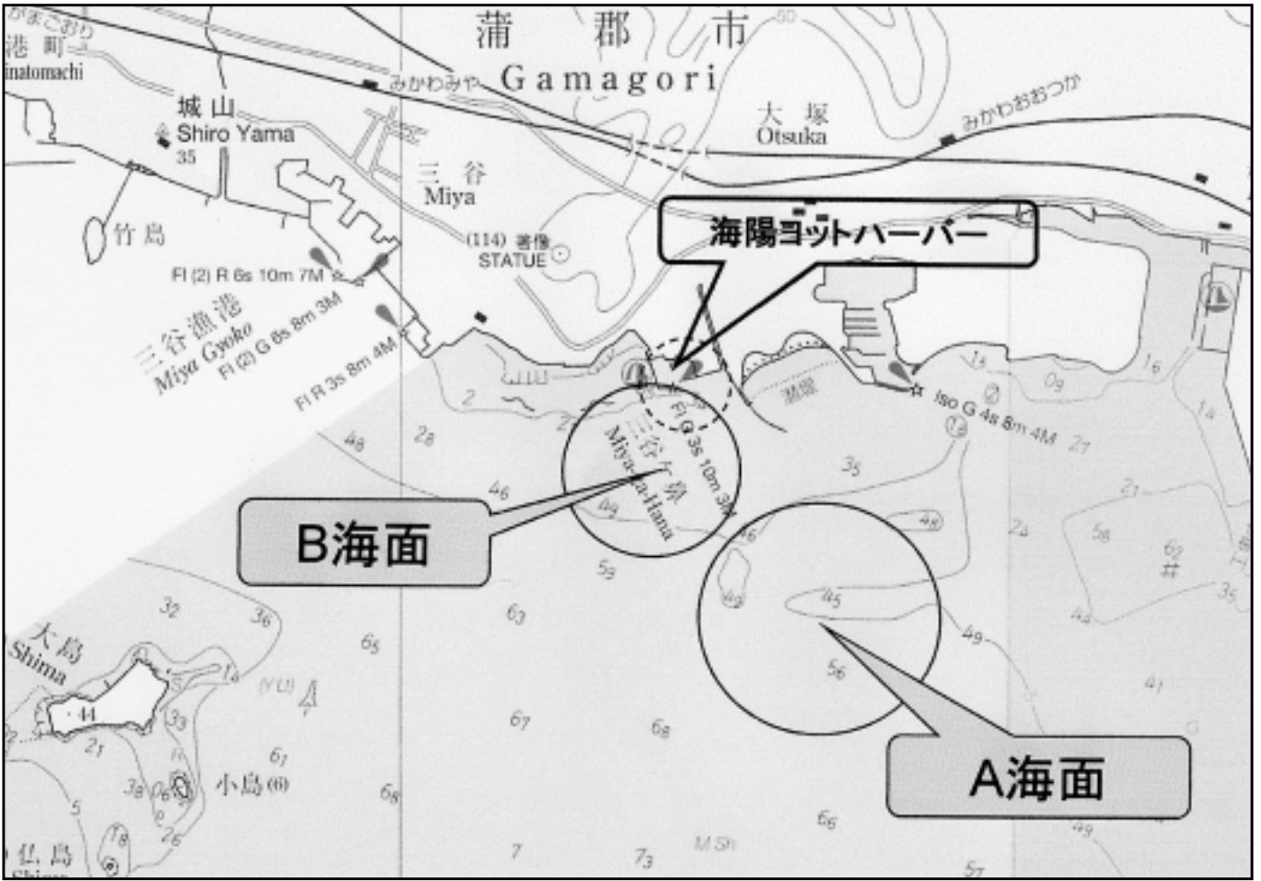
図-1 レースエリア Diagram-1 Racing Area