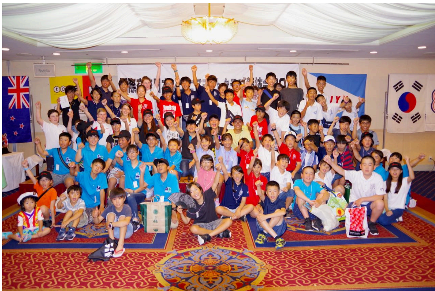
参加選手の皆さん（国際交流会にて）

8 月 2 日の開会式、国際交流会は上記海外 4 チーム、国内 11 チームの 84 名の選手に、60 名を超えるコーチ、応援の保護者を迎えて、運営役員も 80 名余の総勢 220 名に近い規模となりました。