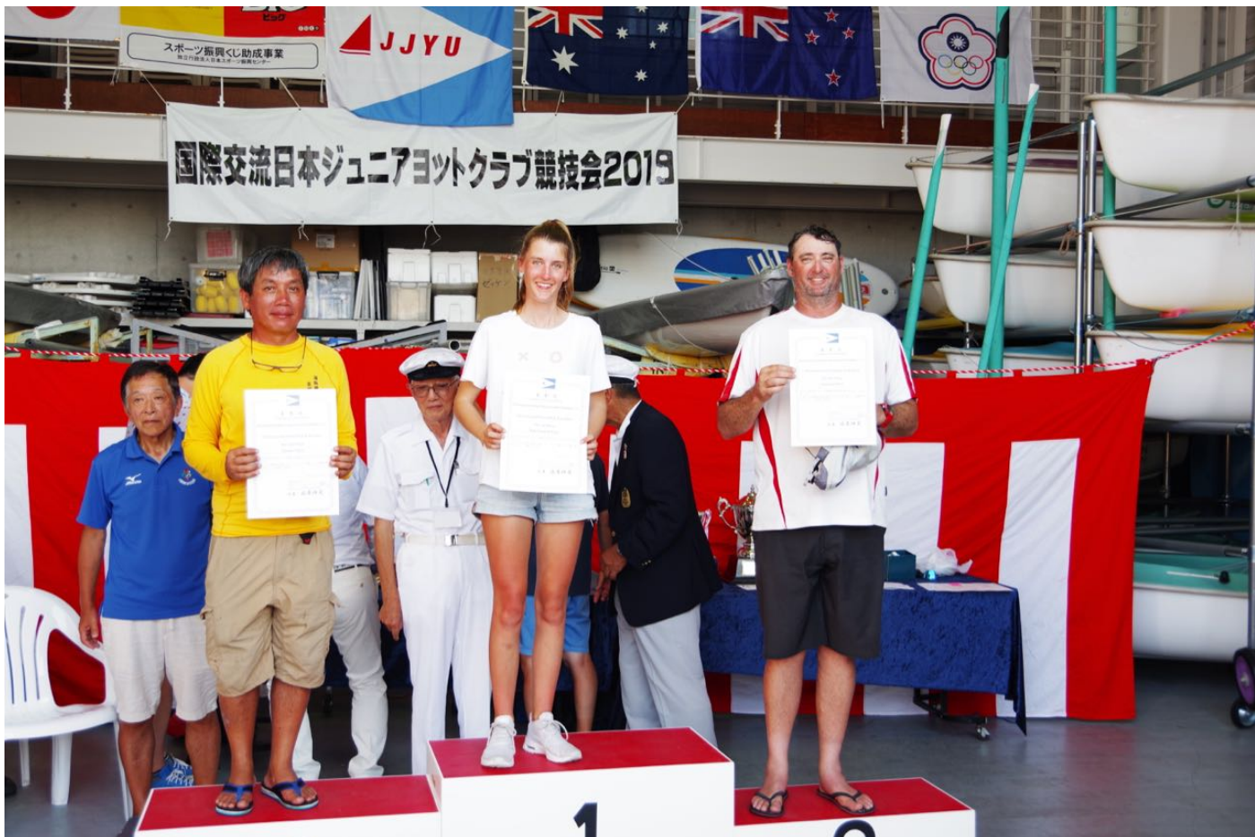
国際交流クラブ対抗レース第1位（JJYU 会長特別杯）ニュージーランドチーム（中央）