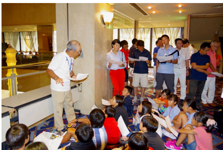
競技運営説明会（B海面）