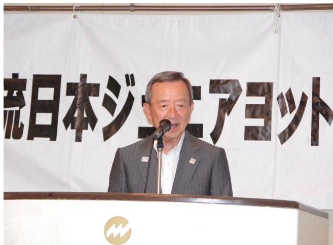
山崎江東区長ご挨拶