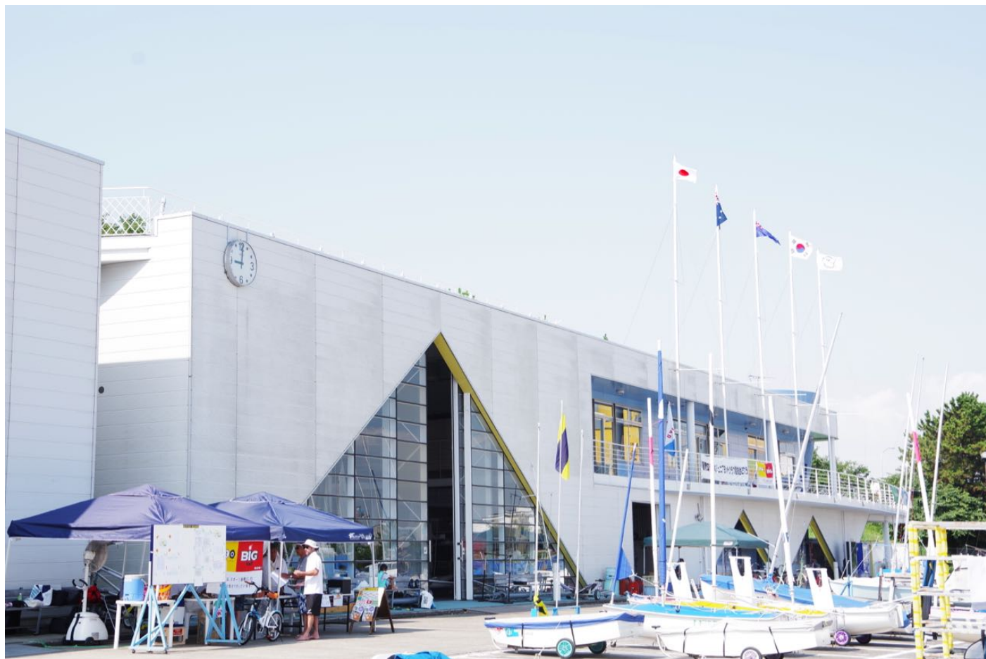
東京都若洲ヨット訓練所