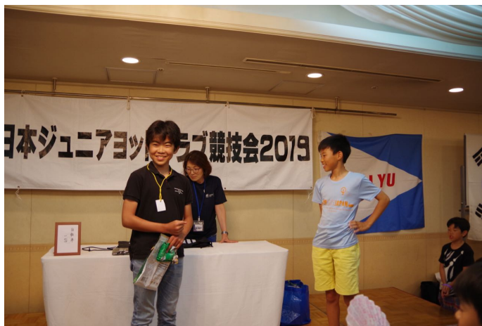
じゃんけん大会自転車をかけた決勝戦