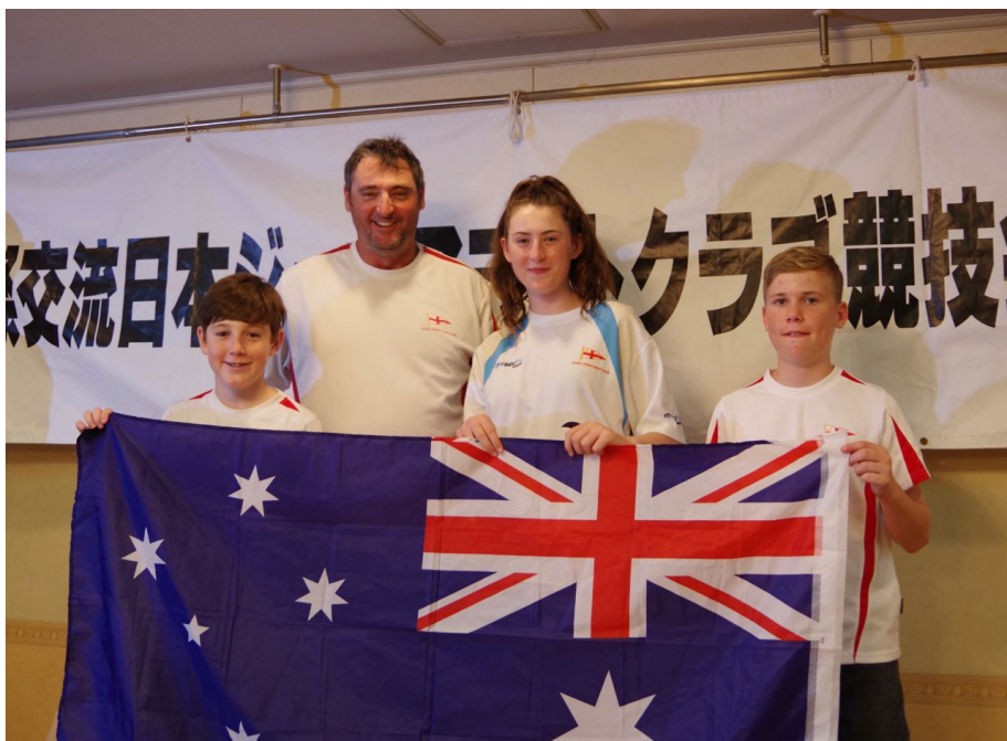
オーストラリアチーム