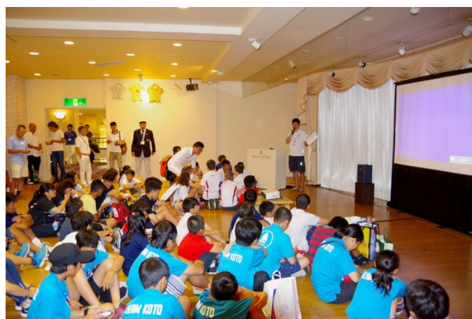
競技運営説明会（A海面）