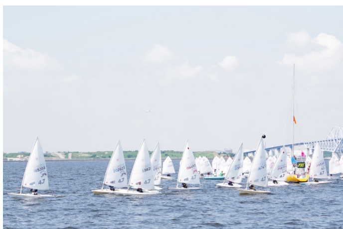
(OP級上級者のレース風景)