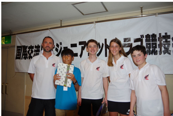
ニュージーランドチーム