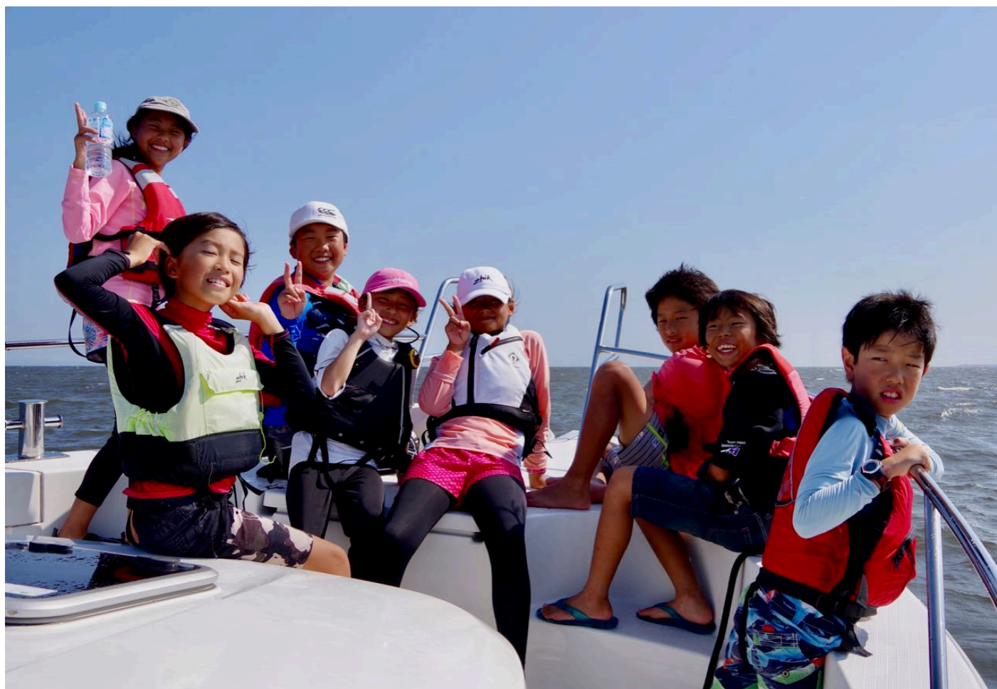
A 海面の観戦をするOP初級者の選手たち